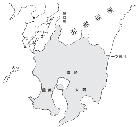
図3：クマソ（球磨曾）の地域

南九州の中央部、鹿児島湾沿岸一帯には、高塚古墳（土や石を盛ったり積んだりして造る古墳）がほとんど存在しない。古墳時代、南九州で特徴的なのは、固有の地下式板石積石室墓で、4世紀後半から7世紀後半にわたって築造されているが、高塚古墳の分布との重なりはほとんどない。それは、ヤマト王権の勢力が及んでいないことを意味する。考古学的には、こうした観点から、熊本県の球磨川流域と宮崎県の一ツ瀬川流域を結んだ線から南側がクマソの勢力圏であったといわれる（図3） 25 。